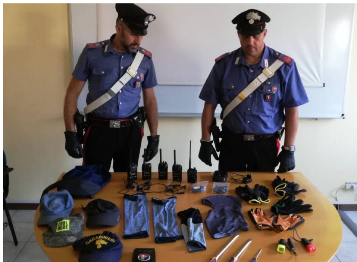
I CARABINIERI del nucleo radiomobile di Chivasso con il materiale sequestrato ai due «presunti» ladri o truffatori

Marito e moglie beccati dai carabinieri a Chivasso: tutto era nascosto tra i giochi dei due figli